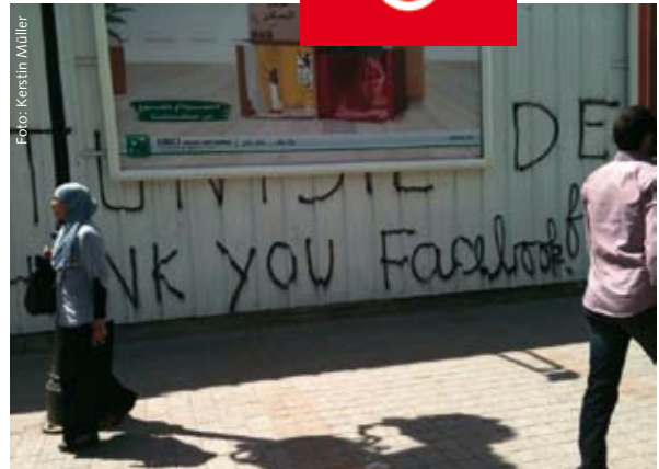
Gesehen in Tunis.

Deshalb ist es von zentraler Bedeutung, dass Deutschland und die EU ihre Märkte für Produkte aus der Region öffnen. Gleichzeitig müssen wir Bildungspartnerschaften für junge Menschen anbieten und gezielte Migration für Arbeit und Ausbildung zulassen. Und Europa muss sich in dieser dramatischen Umbruchphase offen für die Aufnahme von Flüchtlingen zeigen. Das bisherige Gezerre ist unakzeptabel und peinlich. Wir brauchen dringend eine europäische Lastenteilung.