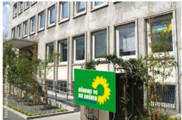
„Neue“ Geschäftsstelle von außen (Planung)

Nun geht es im Sommer mit Volldampf in die Sanierungsmaßnahmen des „alten Büros“. Die Umbauten in der Zeit vom 25. Juli bis 28. August 2011 werden hoffentlich auch die bisherigen KritikerInnen überzeugen. Ein Einweihungsfest folgt noch in 2011.