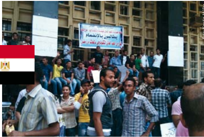
Demo vor dem Hochschulministerium in Kairo.

mit 8.821 Mitgliedern gründen konnte. Der frühe Wahltermin ist daher im Hinblick auf das künftige Kräfteverhältnis zwischen den Muslimbrüdern und den liberalen Parteien sehr gefährlich. Denn gerade das liberale Spektrum könnte nicht genug Zeit haben, um sich bekannt zu machen und Wähler zu gewinnen. Wie die Wahlen in Ägypten ausgehen werden, ist daher völlig offen – jedoch ist eine Mehrheit der Muslimbrüder im neuen Parlament nicht auszuschließen.