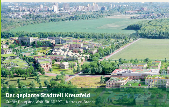
Der geplante Stadtteil Kreuzfeld

Das Gesamtkonzept KölnRheinRuhr setzt auf die Nutzung bestehender oder temporärer Sportstätten. In Köln sollen verschiedene Disziplinen in sieben bestehenden Sportstätten ausgetragen werden. Außerdem soll ein temporäres Leichtathletikstadion sowie das Olympische und Paralympische Dorf im Kölner Norden errichtet werden, welche nach den Spielen teiltrückgebaut und in das neue Zentrum des Stadtentwicklungsprojekts Kreuzfeld integriert werden sollen.